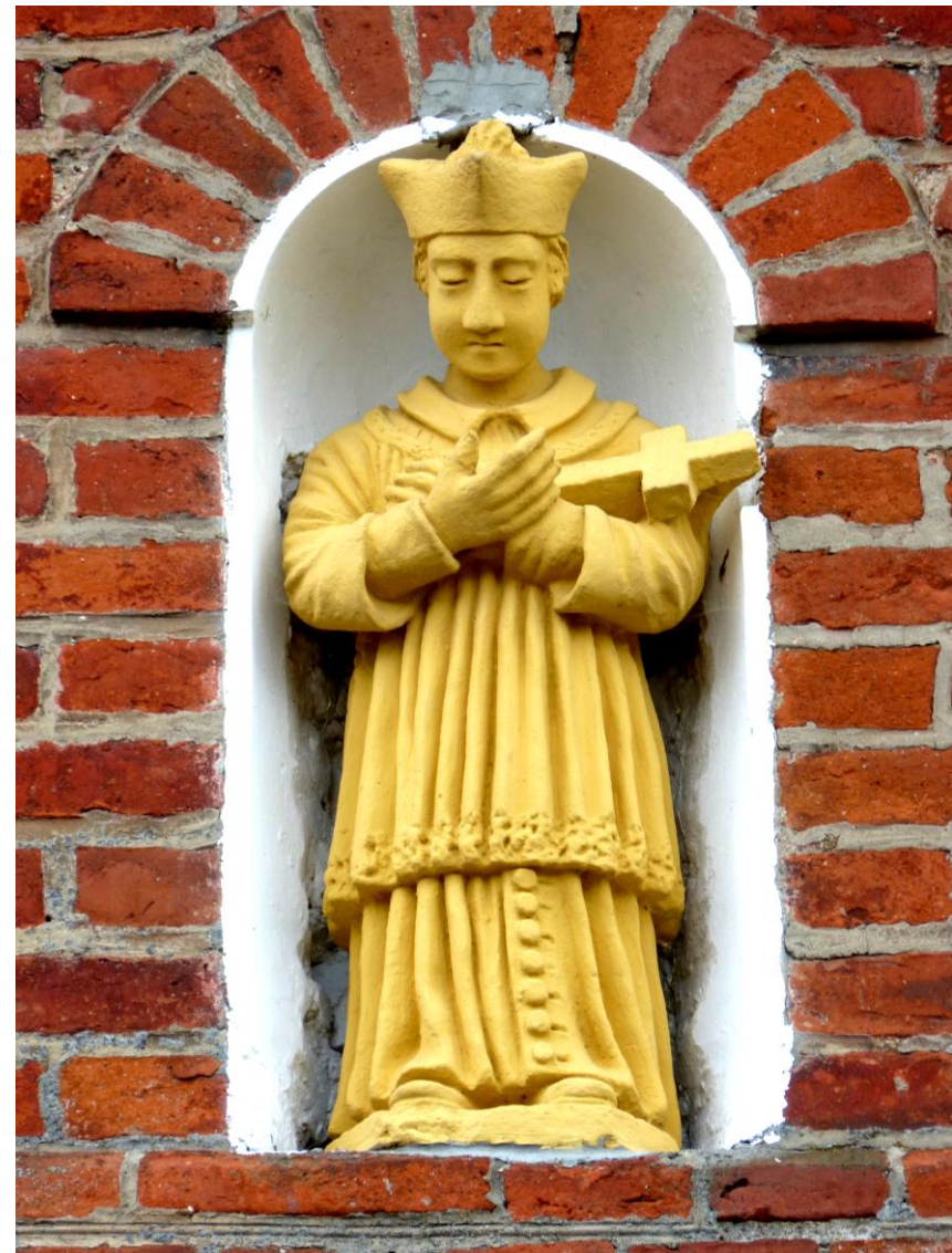
Figura Jana Nepomucena w zewnętrznej niszy lewej wieży neoromańskiego kościoła św. Stanisława BM z 1895-97