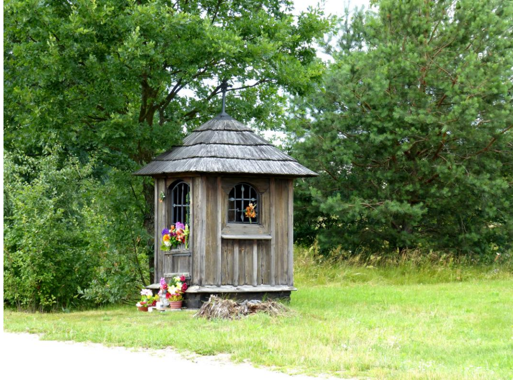
Drewniana kapliczka Jana Nepomucena przy drodze z Sadownego do Zarzetki