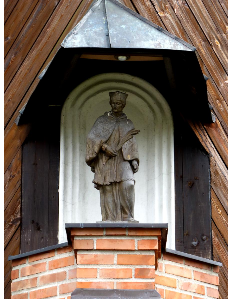
Jan Nepomucen w narożniku drewniano-murowanej XIX-wiecznej dzwonnicy