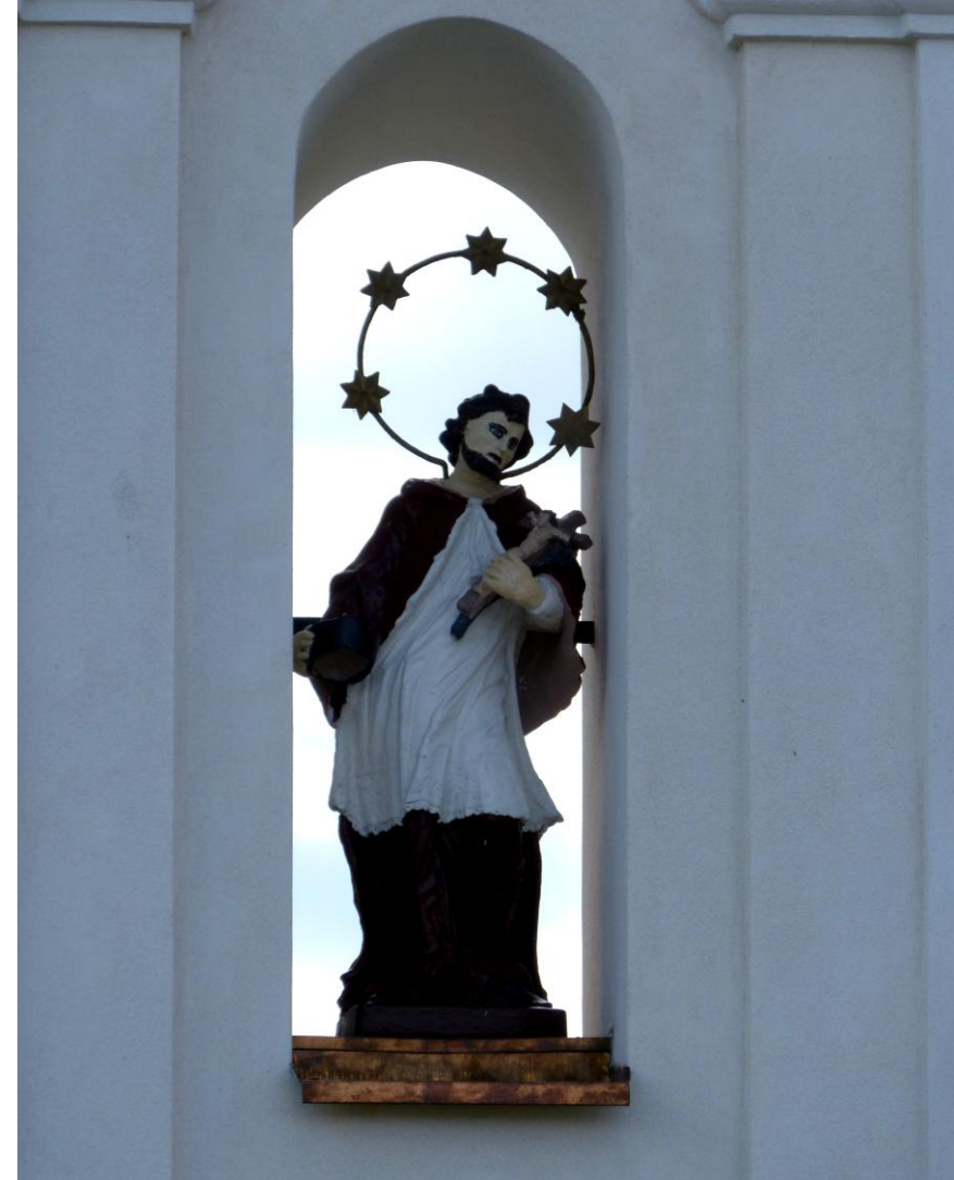
Późnobarokowa kapliczka z III ćw. XVIII przed wejściem na teren kościoła św. Mikołaja. W prześwicie rokokowa figura św. Jana Nepomucena współczesna kapliczce.