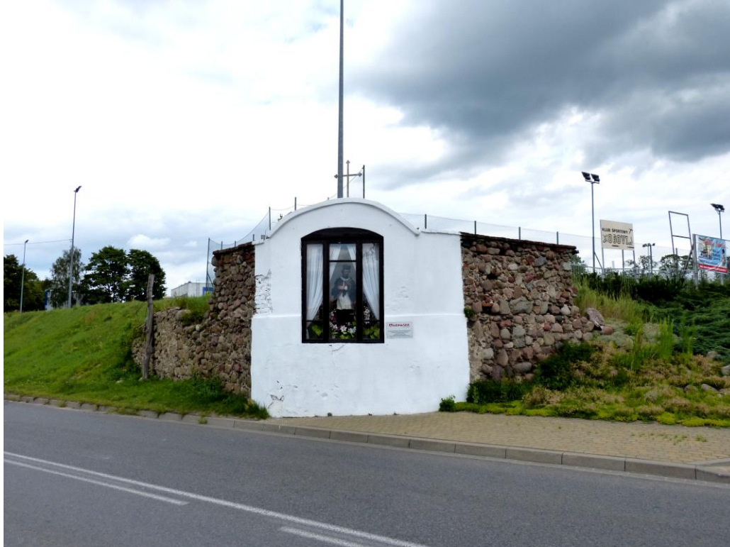
Kapliczka Jana Nepomucena w murze otaczającym dawny park dworski, obecnie stadion Kosovii