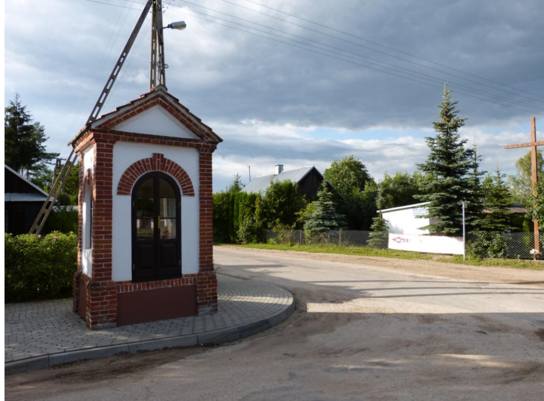
Kapliczka Jana Nepomucena na skrzyżowaniu dróg