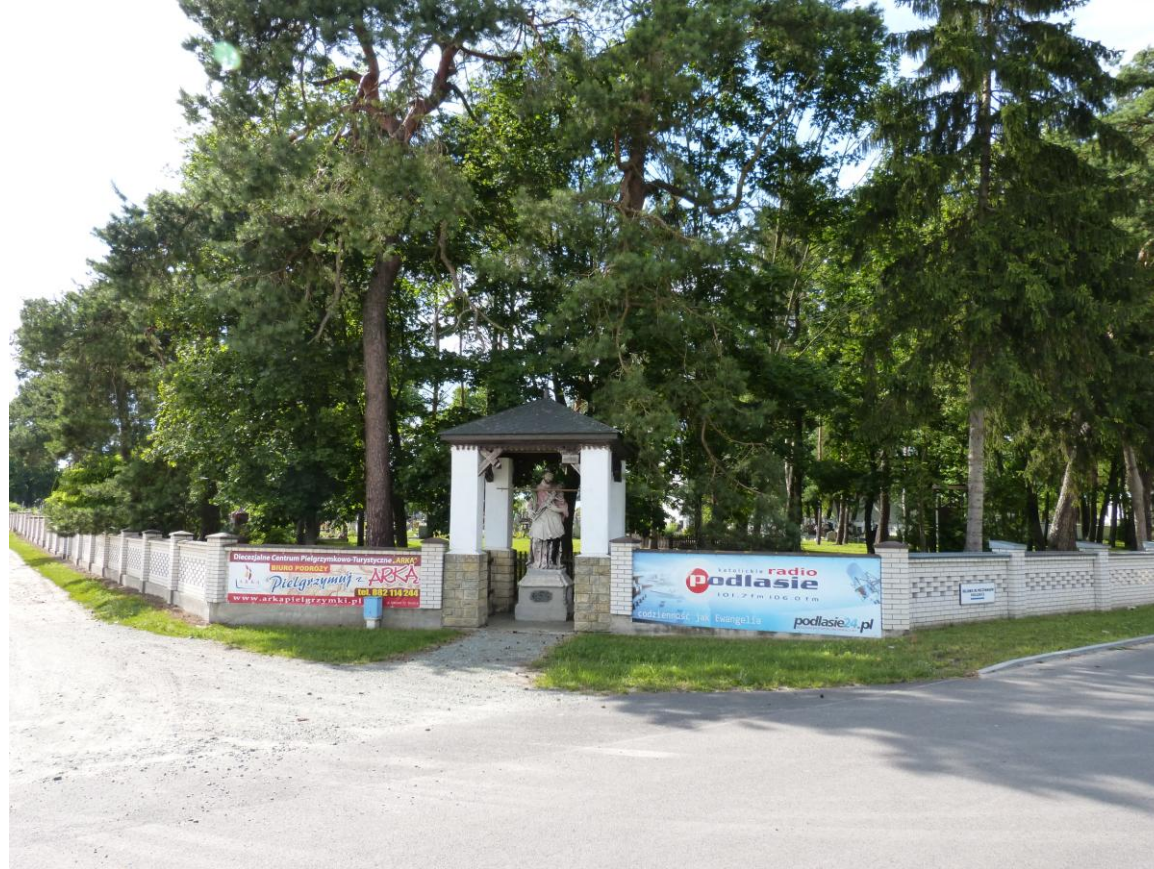
Kapliczka Jana Nepomucena z II poł. XVIII wieku w ogrodzeniu zabytkowego cmentarza przy kościele śś. Piotra i Pawła w Pratulínie.