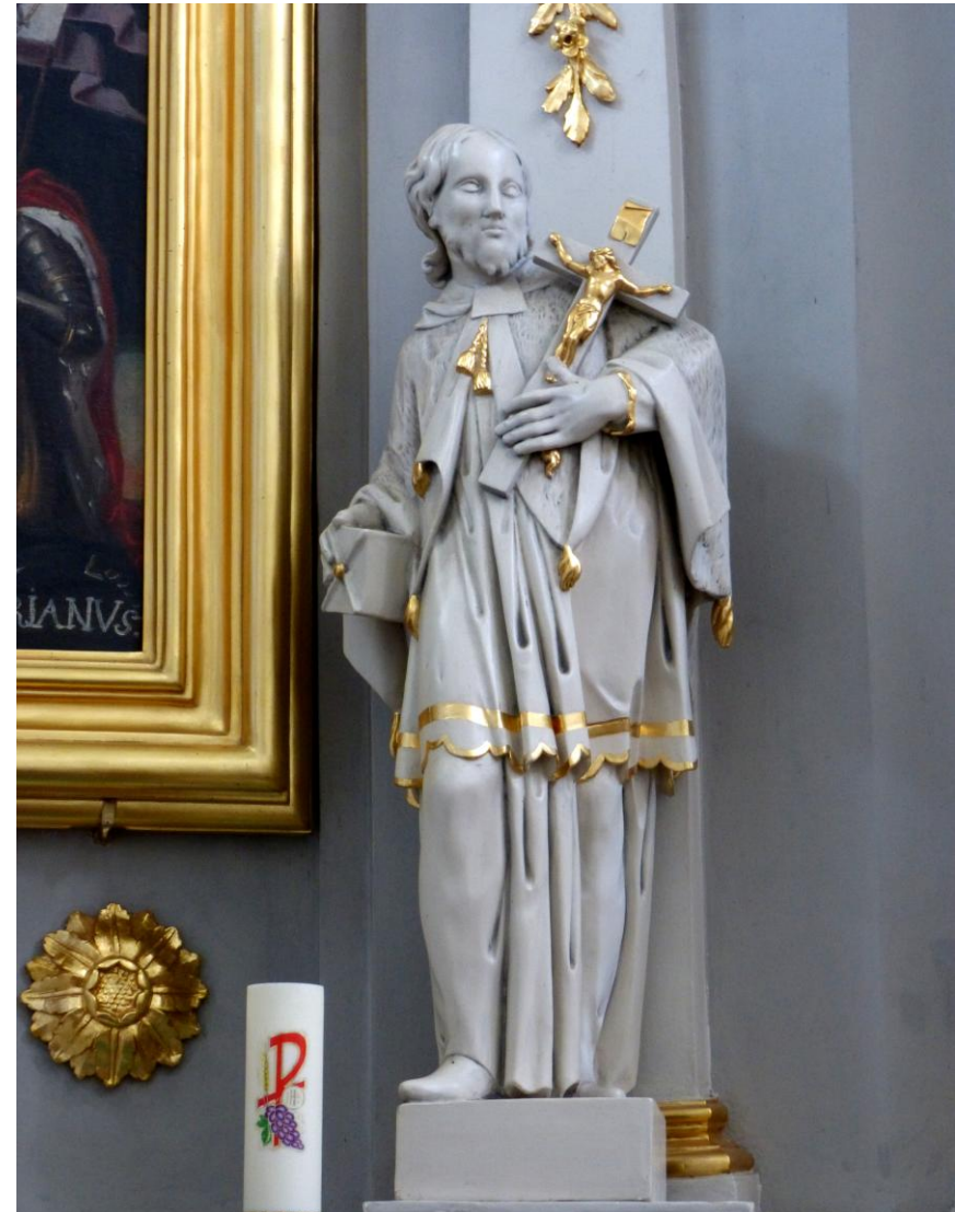
Ołtarz zamykający lewą nawę w barokowym kościele św. Anny z 1776-83. Z prawej strony ołtarza figura Jana Nepomucena z krzyżem w lewej ręce i biretem w prawej.