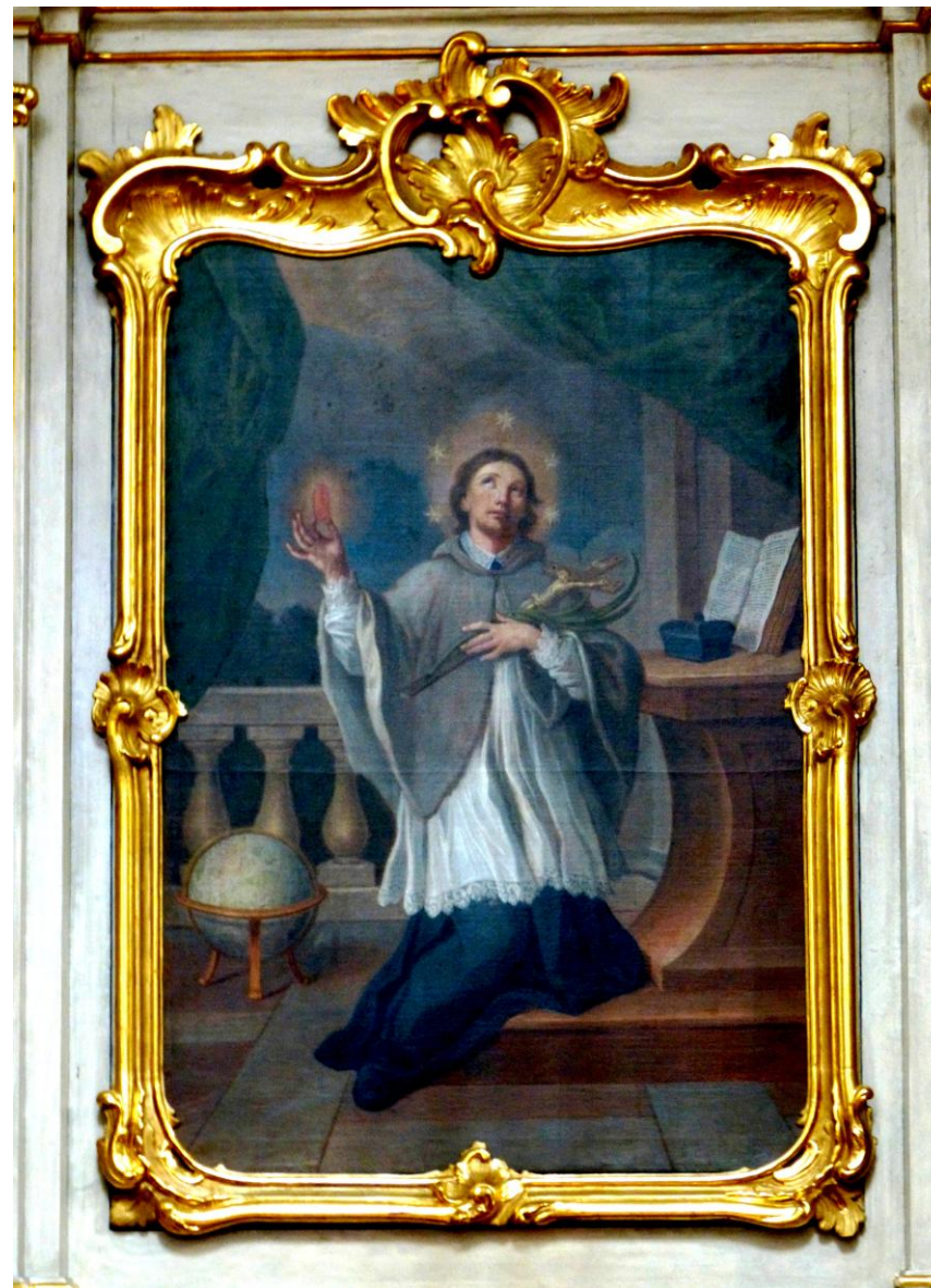
Ołtarz Jana Nepomucena w lewej nawie barokowej kolegiaty Świętej Trójcy z 1714-35